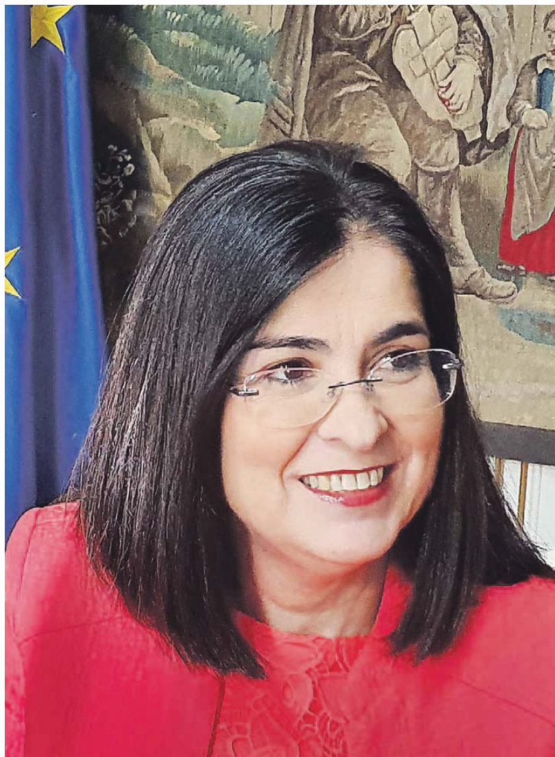
La ministra de Política Territorial y Función Pública, Carolina Darias.